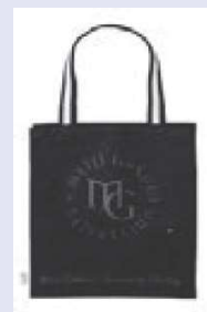
MG Library Bag