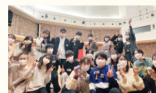
部員の9割が初心者からスタート。