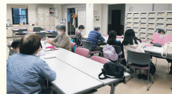
生徒が成長する姿を側で見ることができるのが魅力。

活動のきっかけは、コロナ禍でも誰かのためにできることをしたいと思ったからです。ここでは小学生に対する学習支援を行っています。ボランティア活動を始める事は勇気がいると思いますが、どの団体も温かく迎えてくれるので、一歩踏み出し、すてきな時を過ごしてほしいです。