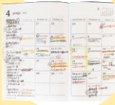
MGダイアリー インターンや面接日などのスケジュール調整で愛用していました。左のメモ欄に反省や期日などを記述すると◎