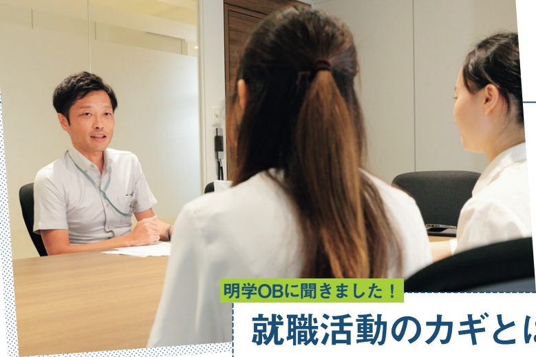
明学OBに聞きました！

最も重要なのは清潔感です。スーツや靴の汚れや爪の手入れ、髪型など事前に確認しましょう。また時計などもシンプルなデザインのものを用意しましょう。