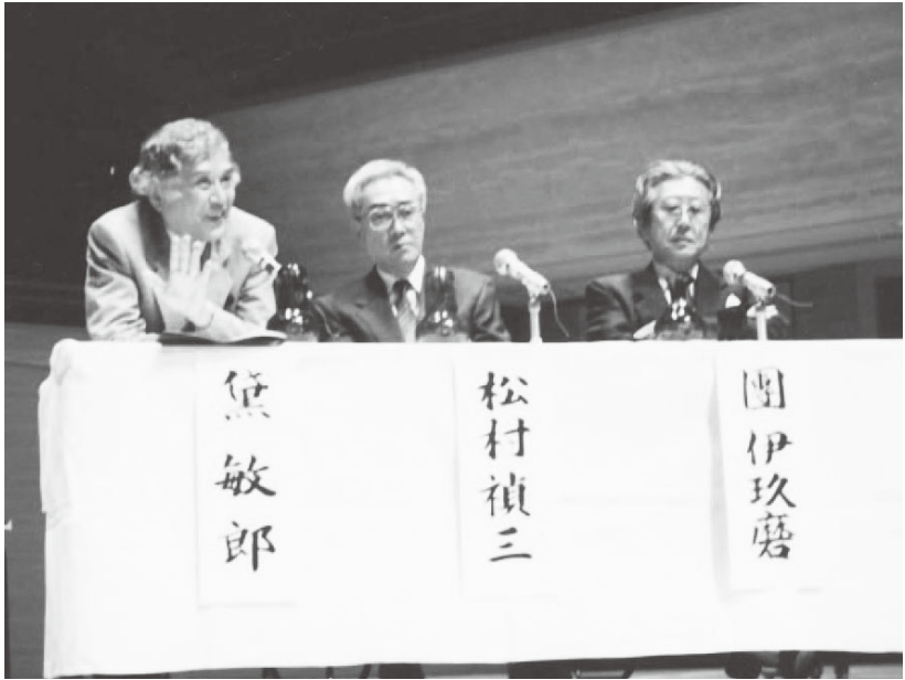
第1回選考演奏会から

回までの候補作、そして受賞作の一覧(表1)を一瞥しただけでも、それは明らかだろう。芥川作曲賞は、今日の日本の作曲界を担わんとする幾多の人材を輩出している。