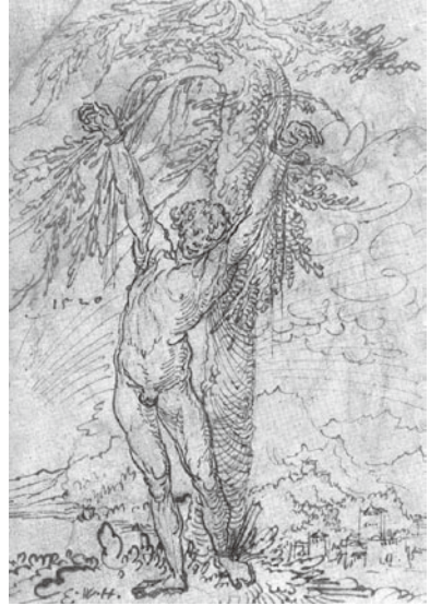
図 19 ヴォルフ・フーバー 『聖セバスチアヌス』 1520年 ペン素描 ベルリン、版画素描室

あろう。『黙示録』第十章第一節でヨハネは大きな天使によって差し出された書物を食べるように言われるわけだが、木版画においては、文字通り書物食べているヨハネの頭髮は彼の背後にある樹木の葉と、身体は彼が埋まっているように見える岩山と同化している。つまりヨハネが天使によって差し出された書物と一体化するように、その身体はすっかり背後の自然に溶け込んでいるのである。ところがデューラーは一五〇四年に『アダムとイブ』(B.C.) 37 という銅版画を制作した。これは彼の長年の人体研究の一つの集大成であり、理想化されたプロポーションを持ち、模範的なコントラストのポーズを取る、まさにルネサンス的なアポロタイプの人間像である。ここで森は、理想化された裸の人間の標本を薄暗がりから際立たせるための舞台セッティングに過ぎなくなった。人間は自然から完全に分離されているのである。ところがアルトドルファーの素描『巨木の間の野蛮人』(ロンドン、大英博物館) (図 20) 38 を見ると、アルトドルファーが魅了されていたのは、未だ自然から分離されていない人間という主題であったことがよく分かる。男は古代的、地中海的な人間像からは遠く離れ、短い足は樹の幹のように太く、背中に背負った木の重みで身体は押しつぶされている。この男の背後に聳える巨木は、いかにこの人間が自然の前では小さな存在かを暗に示しているのである。