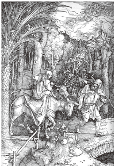
図 13 アルブレヒト・デューラー 聖母伝木版画連作『エジプト逃避』 1504年頃

で裏打ちされたこの小品はサイズが二二、八×二二、二cmであるが、これは「大きい書物」と呼ばれたデューラーの聖母伝連作『エジプト逃避』とほぼ同寸の大きさである。これらの作品に共通しているのは、まったく空が見えないほど樹木で画面が完全に覆われている点だろう。デューラーの森は画面左端の棕櫚の樹と右端のドラセナの木に挟まれて、木々が画面の奥まで立ち並んでいる。聖家族の背景にはキリストの受難を暗示する葡萄の実がなった茂みがあり、一本の樹の幹に沿って葡萄の細い蔦は絡み、繁茂している。この葡萄の細密描写は、まさしくファーン・アイク兄弟の『ゲントの祭壇画』の『神秘の子羊の礼賛』画面左上の葡萄の茂みに端を発するような、近視的な植物の細密描写を木版画で試みたものと言えるだろう。一方のアルトドルファーも一枚一枚の葉を描くような、まさにネーデルラント的な樹木の微視的描写を行っているが、アルトドルファーはここで「徹底して樹木だけで画面を満たす」ことのみに集中しており、静的な初期ネーデルラント絵画に比べてその画面ははるかに生命力と活力に溢れているのである。スイスの美術史家ハインリヒ・ヴェルフリンが「北方の風景においては、樹木と茂み、丘とその樹木があらゆる一貫して流れる生命あるいは運動の感情の中に溶け込んでいる」と表現したように、この小さな油彩画には自然を「生ける自然」として認識したドナウ派の世界観がはっきりと現れている。