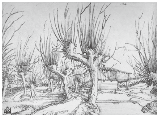
図23 ヴォルフ・フーバー『柳の風景』1514年 ペン素描 ブダペスト、国立美術館

館) (図23) 47 である。ここでフーバーが狙ったのは、あくまでも風景の奥行き、画面に空間を表現することだった。両腕を広げて上に持ち上げたような姿の柳は画面の手前から奥に向かってカーブしてゆく道なりに配置され、あたかも一五一五年頃に制作された『教会内部の素描』(エアランゲン、大学版画素描室) 48 のゴシック式身廊の円柱列とその交差リブポールのように、画面へ奥行きをつける意識で選り取りられている。