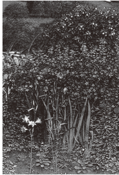
図1 ファン・アイク兄弟 『ゲントの祭壇画』 『神秘の子羊の礼賛』 1432年完成 板絵 ゲント、シント・バーフ大聖堂(部分)

類、土地固有の植物八種類、そして様々なハーブ十八種類の、計三十二種類の特定可能な植物をファン・アイク兄弟は徹視的な精密さで克明に描写していた。 2 『神秘の子羊の礼賛』の画面右上にいる、棕櫚を手にした女性殉教者たちの横に生えた草むらには、左側に薄紫色の花をつけた「あやめ」と右に赤い花をつけた「バラ」が周囲の様々な植物群と共に描かれている。一四三〇年代から圧倒的な初期ネーデルラント絵画の影響下にあったドイツでは、南はバーゼルを中心とした上流ライン地方、そして北はケルンを含む下流ライン地方に至るまで、こうしたネーデルラント絵画に由来する、徹視的な植物が盛んに描かれるようになった。それに伴い、自然観察に基づく植物素描が手