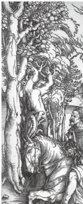
図7 アルブレヒト・デューラー『騎士と兵隊』1496年頃木版画(部分)

ところがデューラーの植物・樹木の描写は版画作品になると一転して全く異なる様相を呈する。『菩提樹』の水彩素描とはほぼ同時期に制作された一枚刷り木版画『騎士と兵隊』（B.111）（図7）の樹木列を見ると、左端の果樹のなつたマンテーニャ風の南国の木の横には、両腕を上げてのけぞった、人間の身体のように力強く曲がりくねった幹を持つ樹が立っている。樹幹