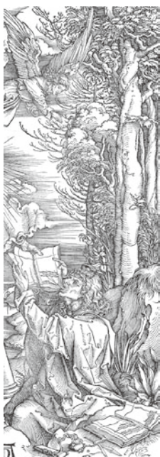
図 18 アルブレヒト・デューラー 『黙示録』「書物を食べるヨハネ」

デューラーとクラナハにも平行現象が見られるが、中でも人間と自然の融合を最も独創的に作品の主題と結びつけたのが、アルブレヒト・デューラーの一四九八年の傑作木版画連作『黙示録』の中の一枚『書物を食べるヨハネ』（B.70）（図18） 36 で