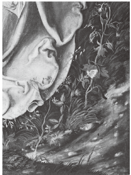
図11 ルーカス・クラナハ 『エジプト逃避の最中の休息』 油彩画(部分)

インスピレーションを与えた。後にザクセン選定候の宮廷画家となり、宗教改革者の肖像画家となったクラナハはオーストリアの地で風景画を発見したのである。クラナハの一五〇四年の油彩画『エジプト逃避』(ベルリン、絵画館)(図10) 22 は古い枝が下に向けて垂れ下がる針葉樹からなる、陰鬱で薄暗い森が舞台となっており、苔が下がった木々と並んで地面には様々な草花が繁茂して、静かで目立たない植物的生命がマリアの衣服の裾まで這い登りながら画面を覆っている(図11)。彩色された紙にペンと白のハイライトを伴って描かれた一五〇三年のクラナハの素描『荒野の聖ヨハネ』(リール、絵画館) 23 は、ヨハ