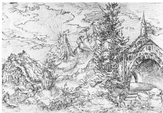
図15 ヴォルフ・フーバー 『ゴルゴタの丘』 1502年 ペン素描 プダベスト、国立美術館

次に見るオーストリアのフェルトキルヒ出身で、司教の宮廷画家としてパッサウに定住したヴォルフ・フーバーは、十九世紀の終わりに再発見されるまで存在が完全に忘れ去られていた画家であった。長らくアルトドルファアの弟子と思われていたが、フランツ・ヴィンツィンガーの一九七九年の包括的な研究を通じてアルトドルファアと互いに交流をもちながら影響しあった同時代の芸術家であることが明らかになった。 30 ヴィンツィンガーが分類したフーバーの作品カタログの素描を概観すると、彼が偉大な同時代人たち、デューラー、クラナハ、そしてアルトドルファアと比較しても際立った個性を持った画家であったことが分かる。