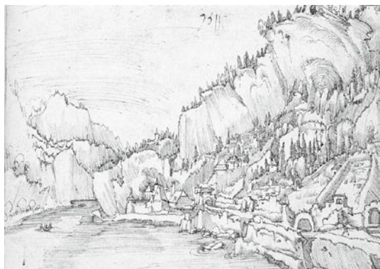
図 17 アルブレヒト・アルトドルファー 『ザルミングシュタインの風景』 1511年 ペン素描 ブダペスト、国立美術館

この即物的で簡素なフーバーのパノラマ風景と好対照をなすのが、アルトドルファーによるペン素描『ザルミングシュタインの風景』（ブダペスト、国立美術館）（図17） 35 だろう。一方のフーバーが低い位置にある地平線を意識した風景であるのに対して、一五二一年にドナウ流域を旅行したアルトドルファーは、逆に垂直に天高く伸びてゆくような、切り立つ山の見えるドナウ渓谷の風景を選んだ。画面右手に大きな壁となつて川岸