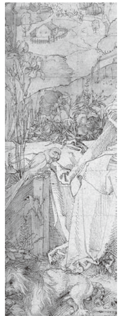
図4 アルブレヒト・デューラー『たぐさんの動物がいる聖母子』 1503年頃 水彩素描 ウィーン、アルベルティーナ(部分)

年の水彩素描「たぐさんの動物のいる聖母子」(ウィーン、アルベルティーナ)(図4)のマリアに添えた。マリアの右手のバラ垣のベンチには、シヨーンガウアーの『聖霊降臨のバラ』と共に、薄紫の花をつけたあやめが描かれたのである。