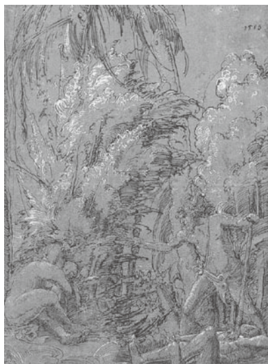
図9 アルブレヒト・アルトドルファア『野蛮人の家族』1510年 ペン素描 ウィーン、アルベルティーナ