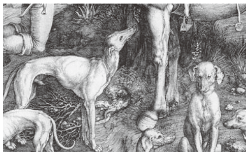
図5 アルブレヒト・デューラー 『聖エウスタキウス』 1500年頃 銅版画(部分)