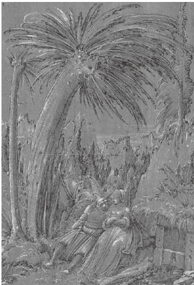
図 22 アルブレヒト・アルトドルファー 『カップル』 1512年頃 ペン素描 個人蔵

をベースとしているのであろう。画面手前の樹木の立っている位置は丘陵で、ドナウ派でお馴染みの、中景を飛び越えて一飛びに対岸の山の斜面を見る風景である。山々はまさに先ほど見たように、草の茎のごとく伸びているのだが、更に画面に大きなインパクトを与えているのは、奇妙に湾曲した奇怪な容貌のこぶのある柳である。樹幹の先に伸びる枝は、自然界の枝とは異なり棕櫚の葉のようであり、一五二二年の素描『カップル』（個人蔵）（図22） 44 に至っては、樹の足下に座る男性の帽子の