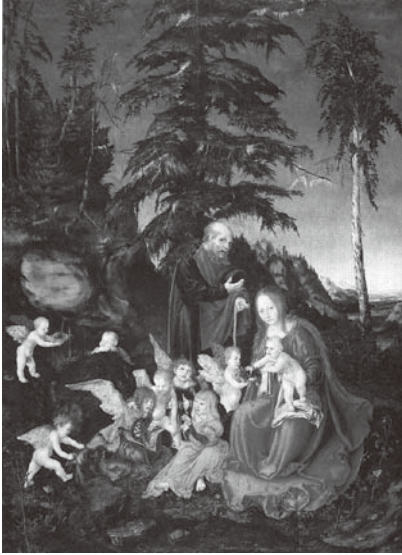
図10 ルーカス・クラナハ 『エジプト逃避の最中の休息』 1504年 油彩画 ベルリン、絵画館

このドナウ派が得意とする、鬱蒼とした針葉樹に覆われた薄暗い森、そして完全に周りの自然に同化してしまった人間像という観点からは、デューラーよりも一五〇二〜一五〇四年にウィーンに滞在していたルーカス・クラナハの作品が決定的な