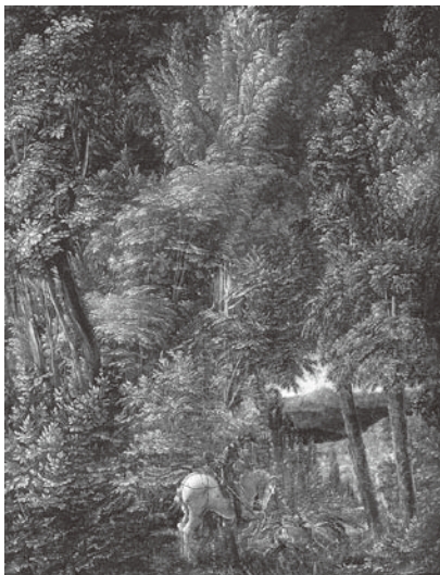
図 14 アルブレヒト・アルトドルファー『聖ゲオルギウスのいる風景』 1510年 板に張った羊皮紙 ミュンヘン、アルテ・ピナコテーク