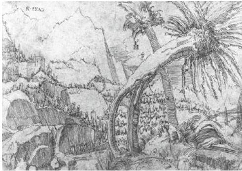
図 21 アルブレヒト・アルトドルファー 『柳の風景』 1511年頃 ペン素描 ウィーン、美術アカデミー