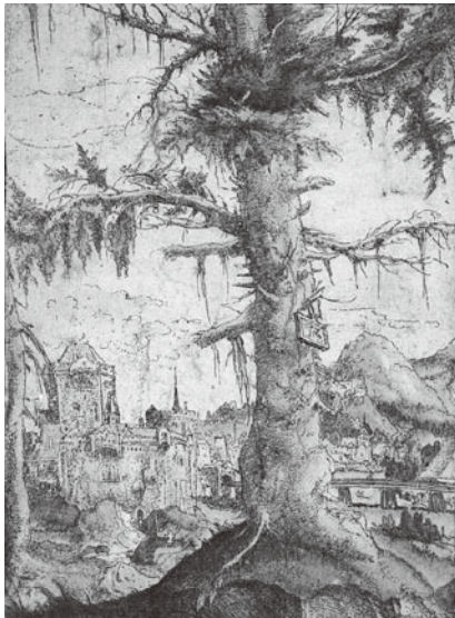
図 24 アルブレヒト・アルトドルファー 『小さな唐檜』 1521年頃 エッチング／着彩

風景エッチングと同様に画面の手前に一本の樹が描かれ、右手には遠方に城塞のある遠景の山が見える。ところがアルトドルファーとは異なり、手前の樹木は画面の途中で切れてはおらず、全身像で画面の中央に描かれている。そしてこの樹の頭上には白く沸き立つ雲が罹っていて、その周辺には光が放射状に、空一面にうねるような光を放っている。アルトドルファーの風景セッティングの場合、我々は個性化された前景の樹木と共に、同じ立ち位置から遠方の景色を眺める感覚に陥るが、フーバーの素描には、この樹木のある景色を一步引いた視点から眺めている画家の視点が存在している。またフーバーの樹と、それを