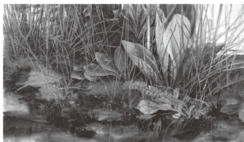
図6 アルブレヒト・デューラー 『大きな草むら』 1503年 水彩素描 ウィーン、アルベルティーナ(部分)

ており、全ての生き物と植物に等しく生命が吹き込まれている点に最大の特徴がある。次にドナウ派絵画の主要モチーフとなった「樹木」について、デューラーの素描と版画を出発点に見てみよう。