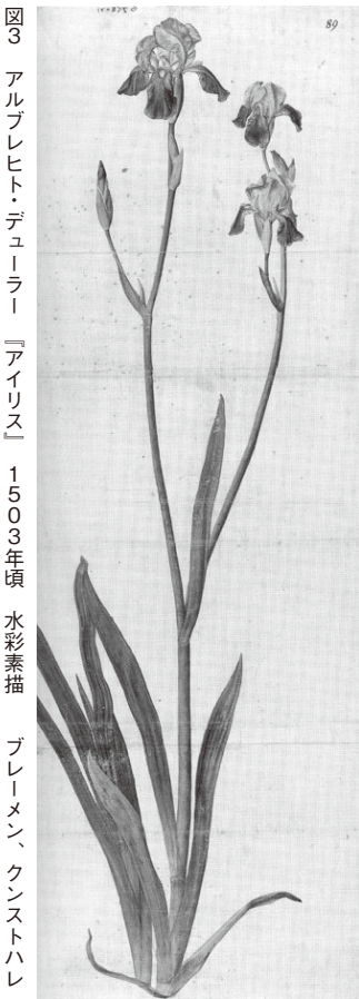
図3 アルブレヒト・デューラー『アイリス』 1503年頃 水彩素描 ブレーメン、クンストハレ

年の水彩素描「たぐさんの動物のいる聖母子」(ウィーン、アルベルティーナ)(図4)のマリアに添えた。マリアの右手のバラ垣のベンチには、シヨーンガウアーの『聖霊降臨のバラ』と共に、薄紫の花をつけたあやめが描かれたのである。