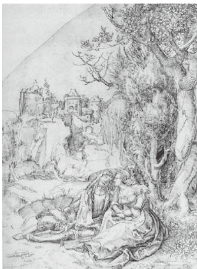
図8 アルブレヒト・アルトドルファア『カッパル』1504年 ペン素描 ベルリン、版画素描室

ここでドナウ派を代表するアルトドルファアの二枚の素描を見てみよう。アルトドルファアはデューラーよりもおよそ十年遅く生まれ、レーゲンスブルクの市民になった一五〇五年から同地で没する一五三八年までの活動が知られている画家・版画家である。一五〇四年と年記がある『恋人たち』と題された素描（ベルリン、版画素描室）（図8）は一時期ウィーン時代のルーカス・クラナハの素描と考えられたが、現在ではアルトドルファアの現存する最初期の素描の一枚とされており、 20 画面右手にはデューラーの木版画『騎士と兵隊』（図7）を彷彿とさせる樹木の茂みがある。しかし一五一〇年のペン素描『野蛮人の家族』（ウィーン、アルベルティーナ）（図9） 21 になると、