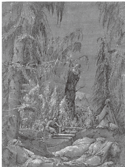
図 12 アルブレヒト・アルトドルファー 『オリブ山でのキリストの祈り』 1509年 ペン素描 ベルリン 版画素描室

ネの巻き毛や毛皮の肩掛けが完全に周囲の植物の線と同化し、ヨハネの上半身は周囲の環境の中に埋没しているのである。荒々しく、人の手が加えられていないような自然が人間を圧倒する様は、アルトドルファーの一五〇九年の素描『オリブ山でのキリストの祈り』（ベルリン、版画素描室）（図12） 24 という主題においても強調されている。本来画面の中心にくるべき祈るイエスの姿は、手前の使徒たちよりもはるかに小さく画面の右端に置かれ、その背後には枯れて枝が下に向けて垂れた大木が、イエスの上に覆い被さるように聳えている。また画面手前の三人の眠る使徒たちは力が抜け切って土塊のように地面