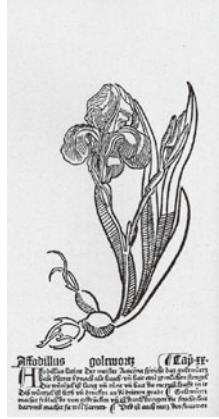
図2 『健康の庭』 第20章『あやめ』 1485年 木版画 マインツ

関心からの自然観察という視点が融合し、結実していたのである。デューラーのあやめ素描の最大の特徴は、二枚の紙を張り合わせ、縦の長さが七七・五cmもあるまさに花の原寸大の大きさに基づき描かれたナチュラリスタディードという点である。純粹な自然観察に基づいて描かれたこの花をデューラーはシヨーンガウアーと同様にマリアのシンボルとして、一五〇三