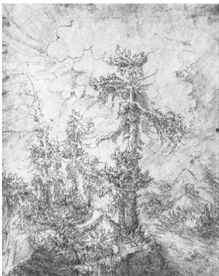
図 25 ヴォルフ・フーバー 『樹のある風景』 1531年頃 ペン素描 キール、クンストハレ

風景エッチングと同様に画面の手前に一本の樹が描かれ、右手には遠方に城塞のある遠景の山が見える。ところがアルトドルファーとは異なり、手前の樹木は画面の途中で切れてはおらず、全身像で画面の中央に描かれている。そしてこの樹の頭上には白く沸き立つ雲が罹っていて、その周辺には光が放射状に、空一面にうねるような光を放っている。アルトドルファーの風景セッティングの場合、我々は個性化された前景の樹木と共に、同じ立ち位置から遠方の景色を眺める感覚に陥るが、フーバーの素描には、この樹木のある景色を一步引いた視点から眺めている画家の視点が存在している。またフーバーの樹と、それを