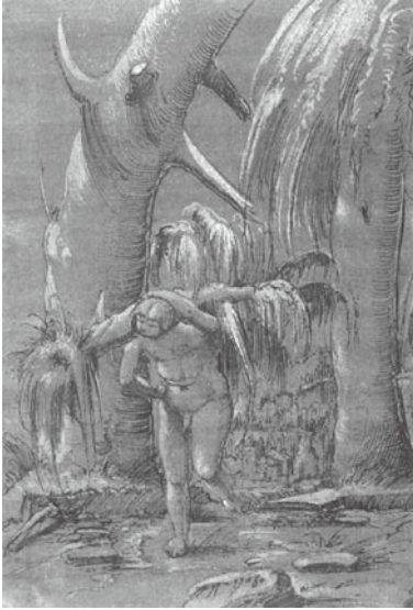
図 20 アルブレヒト・アルトドルファー 『野蛮人の男』 1508年 ペン素描 ロンドン、大英博物館