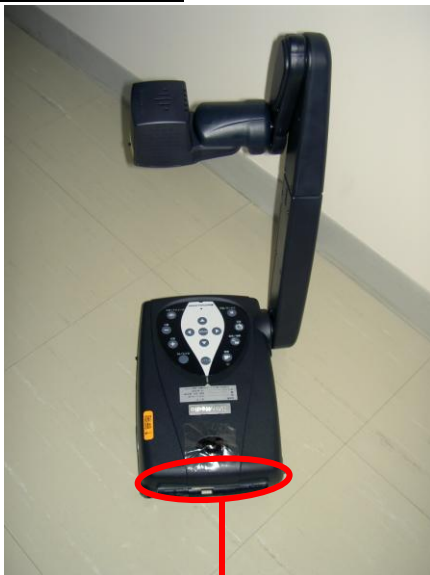
図2. OHC 接続