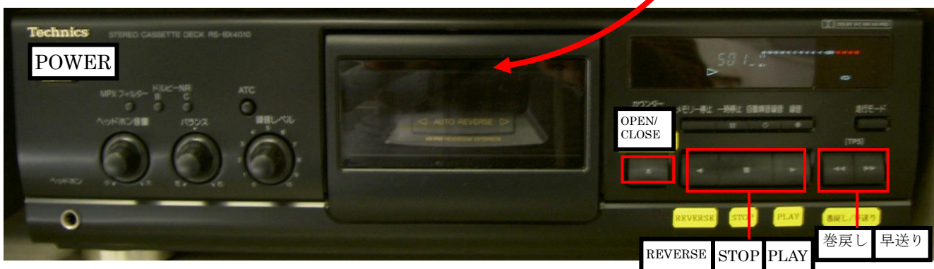
シングルカセットデッキ