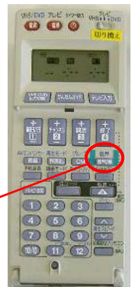
図3. ふたを開いたところ