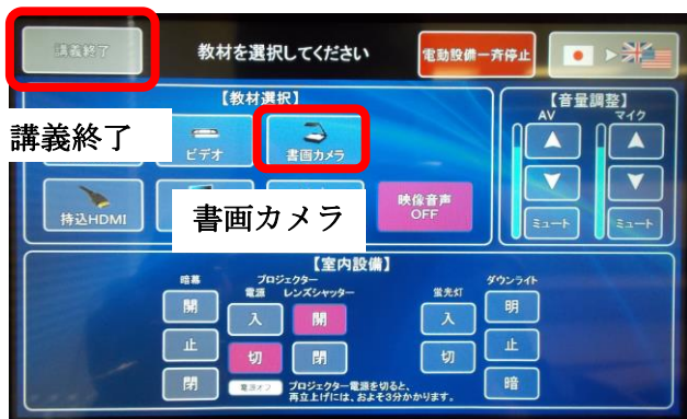
図1. 操作盤タッチパネル