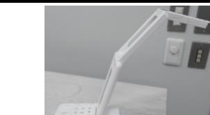
ポータブルOHC(書画カメラ)