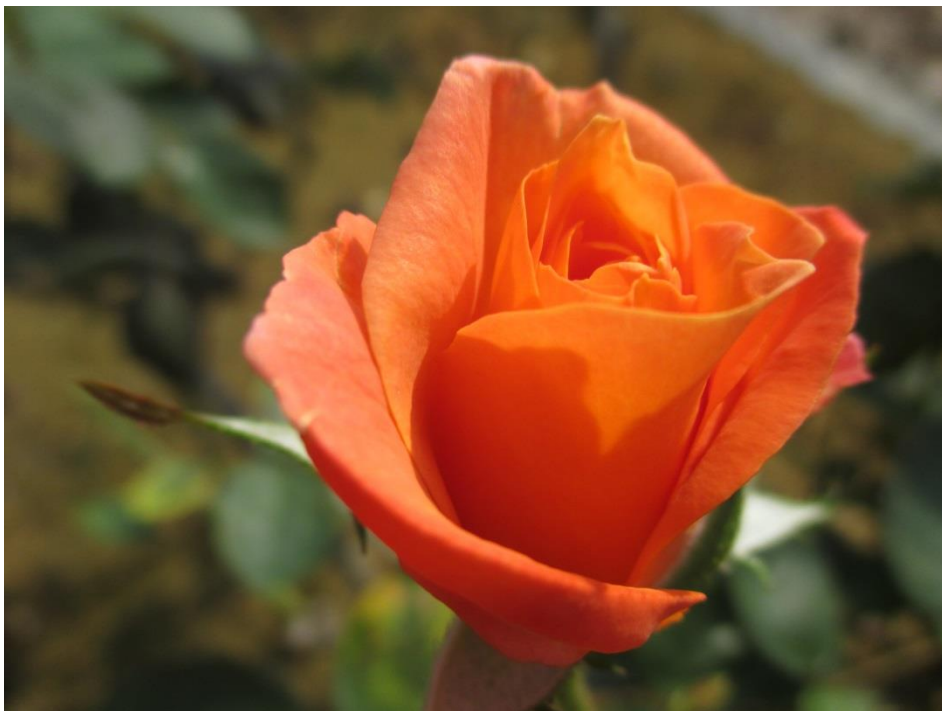
横浜校舎のアンネの薔薇