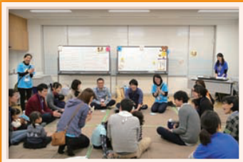
▲親子でふれあい遊びを楽しみました。