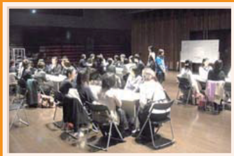
▲多世代で話した井戸端会議