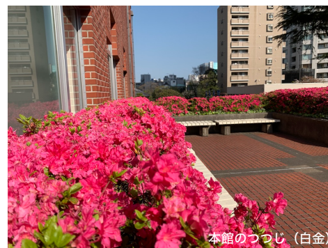
本館のつつじ (白金)