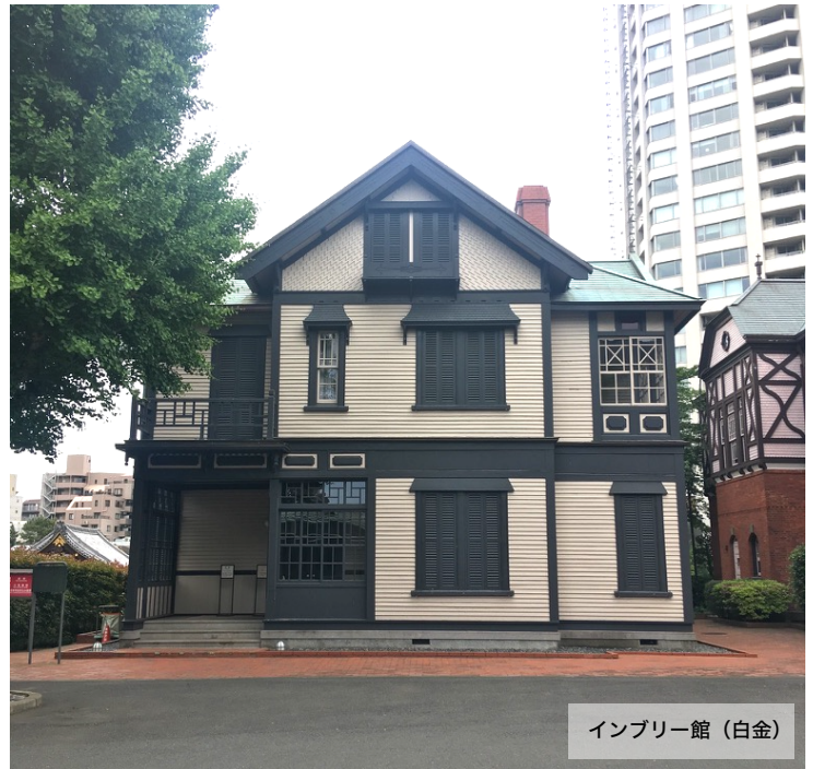
インプリー館 (白金)

そんな状態から立ち直るきっかけをくれたのは、子どもの頃から教会へ一緒に行っていた友人の見舞いでした。ある日、その友人が一人でふらっと病室を訪れ、聖書や教会の話ではなく何気ない日常会話をして帰って行きました。でもその会話の中から、他者のため十字架にかかり自らの命をささげたイエスのことが思い起こされたのです。「俺のこんな気持ち誰もわかってくれない」「神なんて本当にいるのか？」怪我の苦しみを自分本位に捉え、暗く閉ざしていた私の心の中でイエスという存在が光を放ちました。友人が去って一人になった時、涙が溢れてきましたが、それは「こんな自分でも生きている意味がある」ということに気付かされた喜びの涙でした。そして、その時から今の自分に出来ることは何かを考えるようになりました。私はどん底を味わいましたが、この経験を通して本当の光、絶対に消えることのない希望の光を持つことが出来ました。