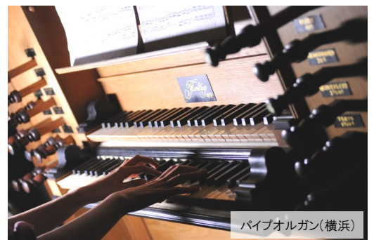
パイプオルガン(横浜)