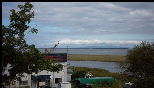
別海より国後を望む

●会場 = 明治学院大学白金キャンパス 2号館 2301教室 〒108-8636 東京都港区白金台1-2-37